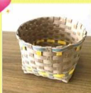
「はじめて一人で作った～」 by生徒さん!(!)!