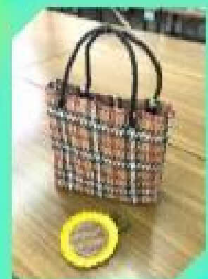
バーバリー風バッグも