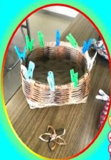
よろい編みのカゴ★