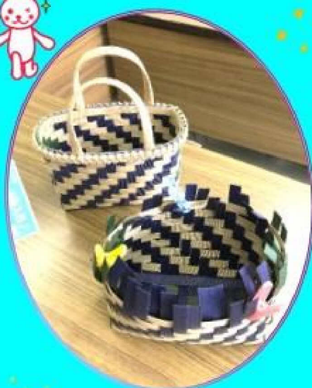
あじろ編みのバッグ♡